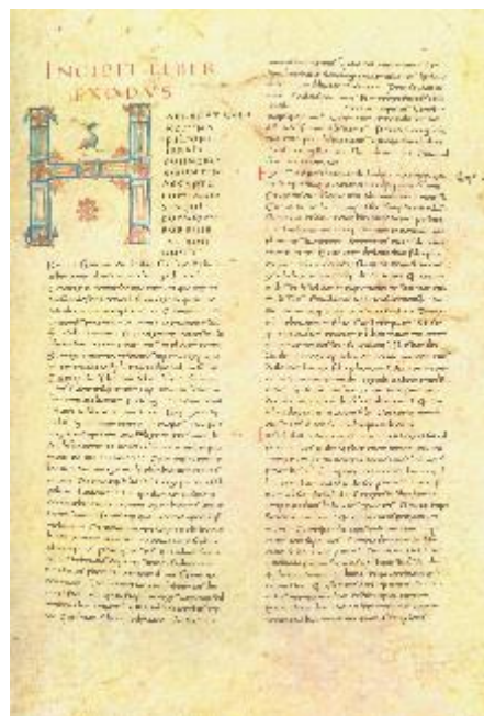
Bibelübersetzung Buch Exodus Tours 9. Jahrh.