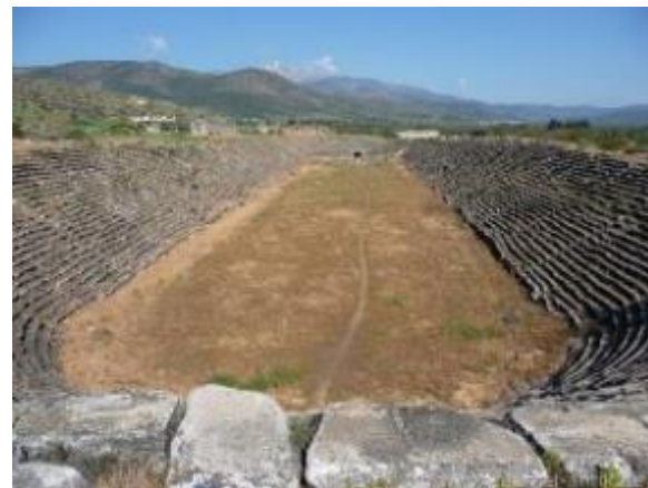
Stadion, Aphrodisias (heute Geyre, Türkei)