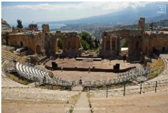
Theater, Taormina (Sizilien)